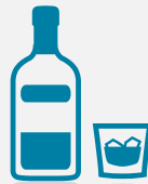
Verre de whisky 40% vol. (3 cl)

Volumes de différentes boissons alcooliques équivalents à environ 10 g d'alcool pur