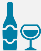
Verre de vin 12% vol. (10 cl)